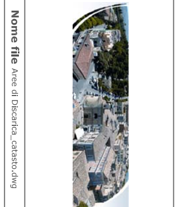
Nome file Aree di Discarica_catastro.dwg